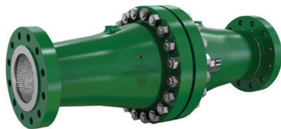
费希尔™ (Fisher™) WhisperTube 模态降噪器